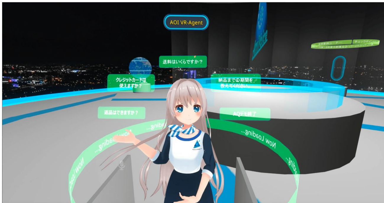
「AI Avatar AOI」

さらに、2023年10月17日（火）～20日（金）に幕張メッセにて開幕される「CEATEC 2023」に出展し、正式リリースした「AI Avatar AOI」を初披露します。