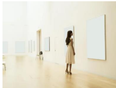
ショールーム・展示会