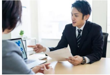
製品紹介・デモンストレーション