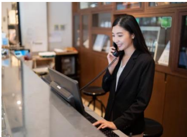
受付・レセプション