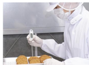
食品製造での検査に