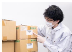
出入荷確認・棚卸作業に