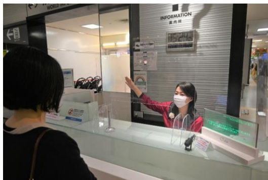
音声認識技術を活用しご案内の様子