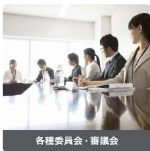
各種委員会・審議会