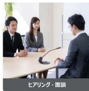
ヒアリング・面談