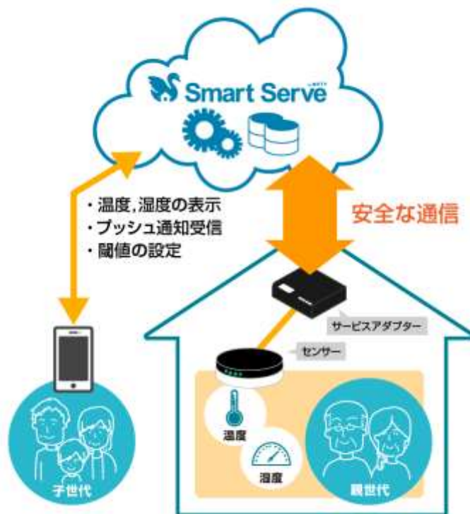
【「おへやプラス」利用イメージ】

「おへやプラス」のサービスでは、離れて暮らす家族の部屋の温度や湿度を、ニフティが開発する専用のスマートフォンアプリから簡単に確認をすることができます。今回ニフティが提供する「おへやプラス」は、ニフティの手軽なVPNサービス「スマートサブ」と、当社が提供する「iRemocon Wi-Fi」を活用した“室内環境見守りサービス”です。室内の温度や湿度をスマートフォンから簡単に確認することができる機能のほか、季節性インフルエンザや熱中症の危険性を知らせるアラート機能などを提供します。