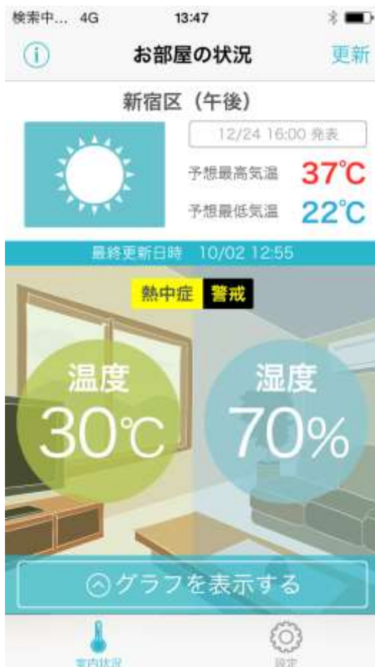
【アプリ 温度・湿度表示画面】

※詳細はニフティのサービス紹介ページ( http://smartserve.nifty.com/home/plus/ )をご確認ください。