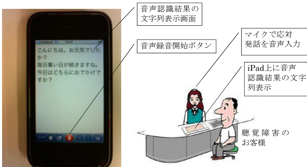
【iPhone 上での音声認識イメージ】