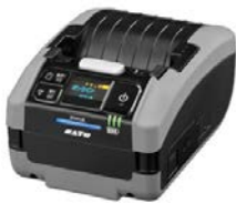
連携するモバイルプリンタ