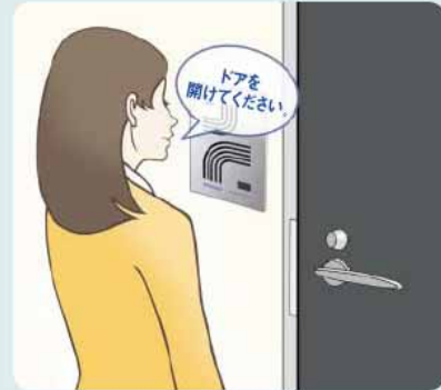
声紋認証入退出システム AmiVoice® Guard